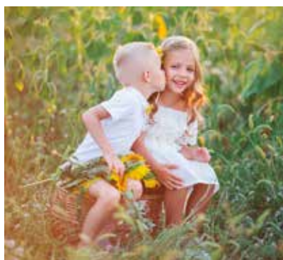
REF. CN 46 / CN 46R

Todos nuestros artículos referenciados con "R" incluyen la reimpresión de su publicidad.