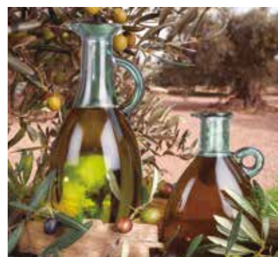
REF. CN 54 / CN 54R