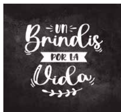
REF. CN 75 / CN 75R