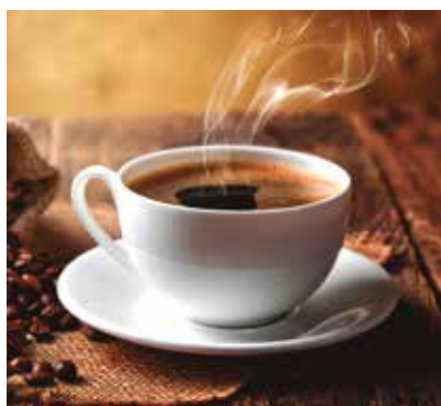
REF. CN 52 / CN 52R