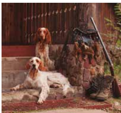
REF. CN 65 / CN 65R