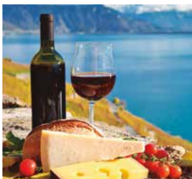
REF. CN 59 / CN 59R