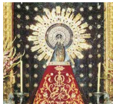
REF. CN 72 / CN 72R Virgen del Pilar