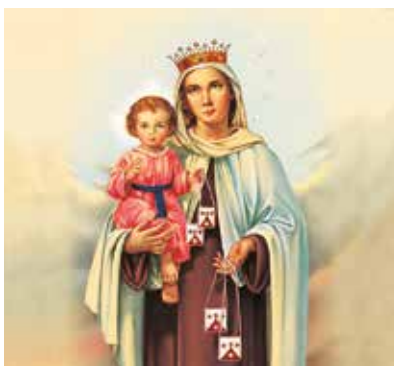
REF. CN 71 / CN 71R Virgen del Carmen