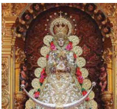
REF. CN 68 / CN 68R Virgen del Rocío