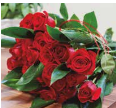
REF. CN 50 / CN 50R