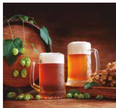
REF. CN 60 / CN 60R