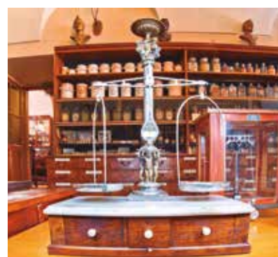
REF. CN 51 / CN 51R