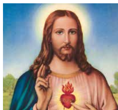
REF. CN 69 / CN 69R Sagrado Corazón de Jesús