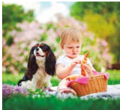
REF. CN 44 / CN 44R