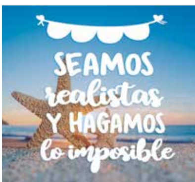
REF. CN 80 / CN 80R