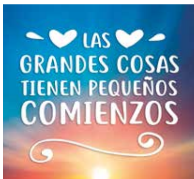
REF. CN 76 / CN 76R