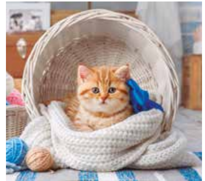
REF. CN 42 / CN 42R