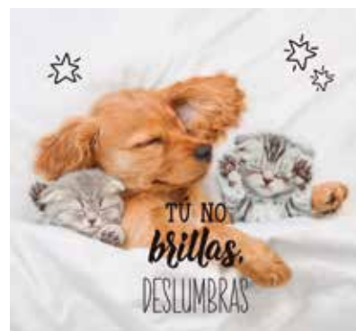
REF. CN 78 / CN 78R