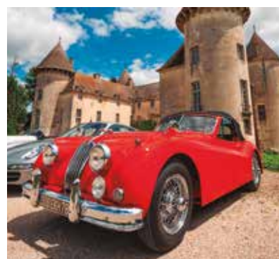
REF. CN 63 / CN 63R