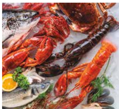
REF. CN 58 / CN 58R

Calendarios con imán para nevera. Tamaño 12 x 25,5 cm. Cartoncillo 300 gr. Plástico brillo. Espacio publicidad: 11 x 4 cm.