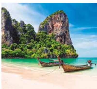
REF. CN 49 / CN 49R