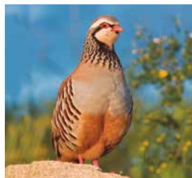
REF. CN 66 / CN 66R