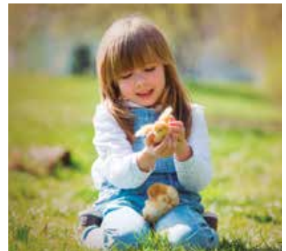
REF. CN 45 / CN 45R