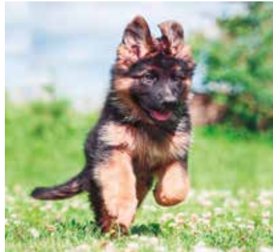
REF. CN 41 / CN 41R