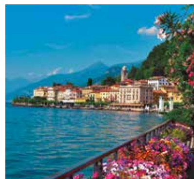
REF. CN 48 / CN 48R