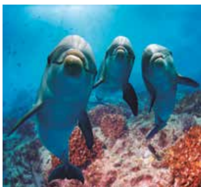
REF. CN 62 / CN 62R