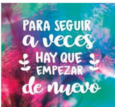
REF. CN 77 / CN 77R