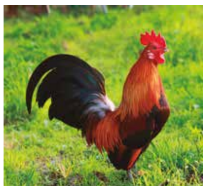
REF. CN 61 / CN 61R