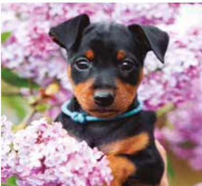
REF. CN 43 / CN 43R