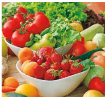
REF. CN 55 / CN 55R