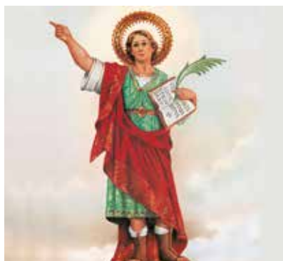
REF. CN 70 / CN 70R San Pancracio

Todos nuestros artículos referenciados con "R" incluyen la reimpresión de su publicidad.