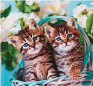
REF. CN 40 / CN 40R