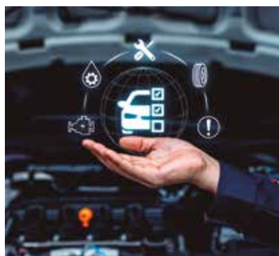
REF. CN 64 / CN 64R