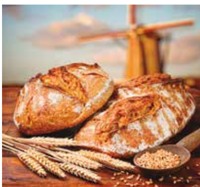
REF. CN 53 / CN 53R