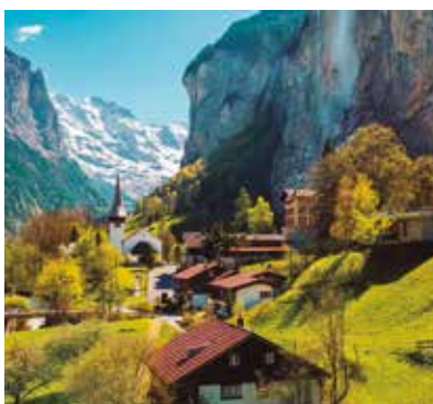
REF. CN 47 / CN 47R