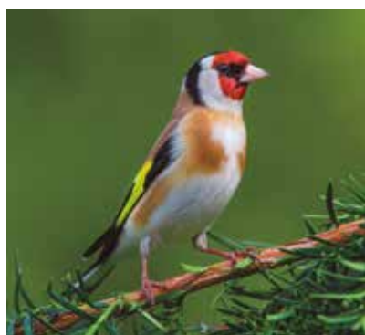
REF. CN 67 / CN 67R