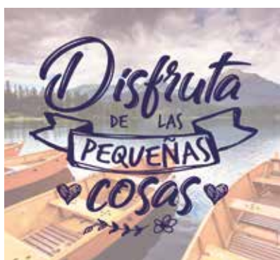
REF. CN 79 / CN 79R