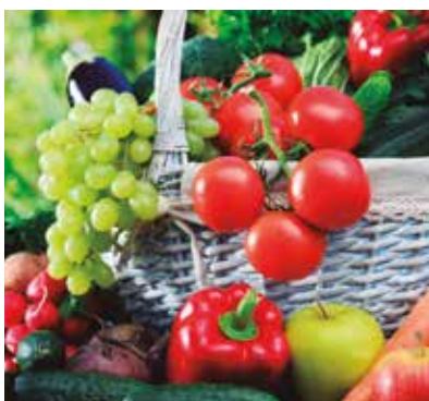
REF. CN 56 / CN 56R