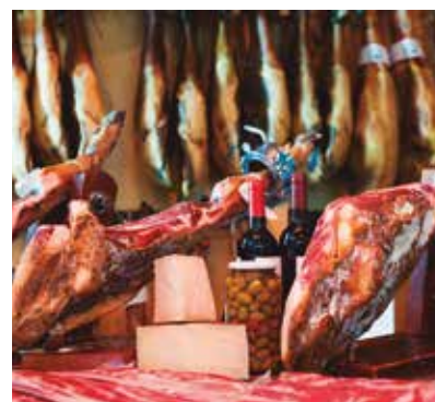
REF. CN 57 / CN 57R