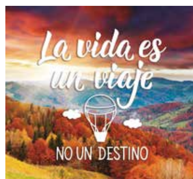
REF. CN 81 / CN 81R