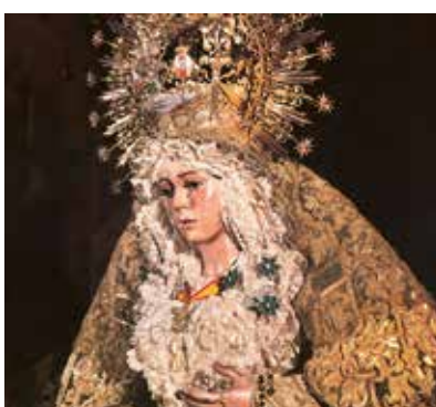
REF. CN 74 / CN 74R Virgen de la Macarena